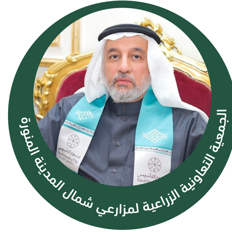
عبدالماجد بن عبدالله القين نائب رئيس المجلس